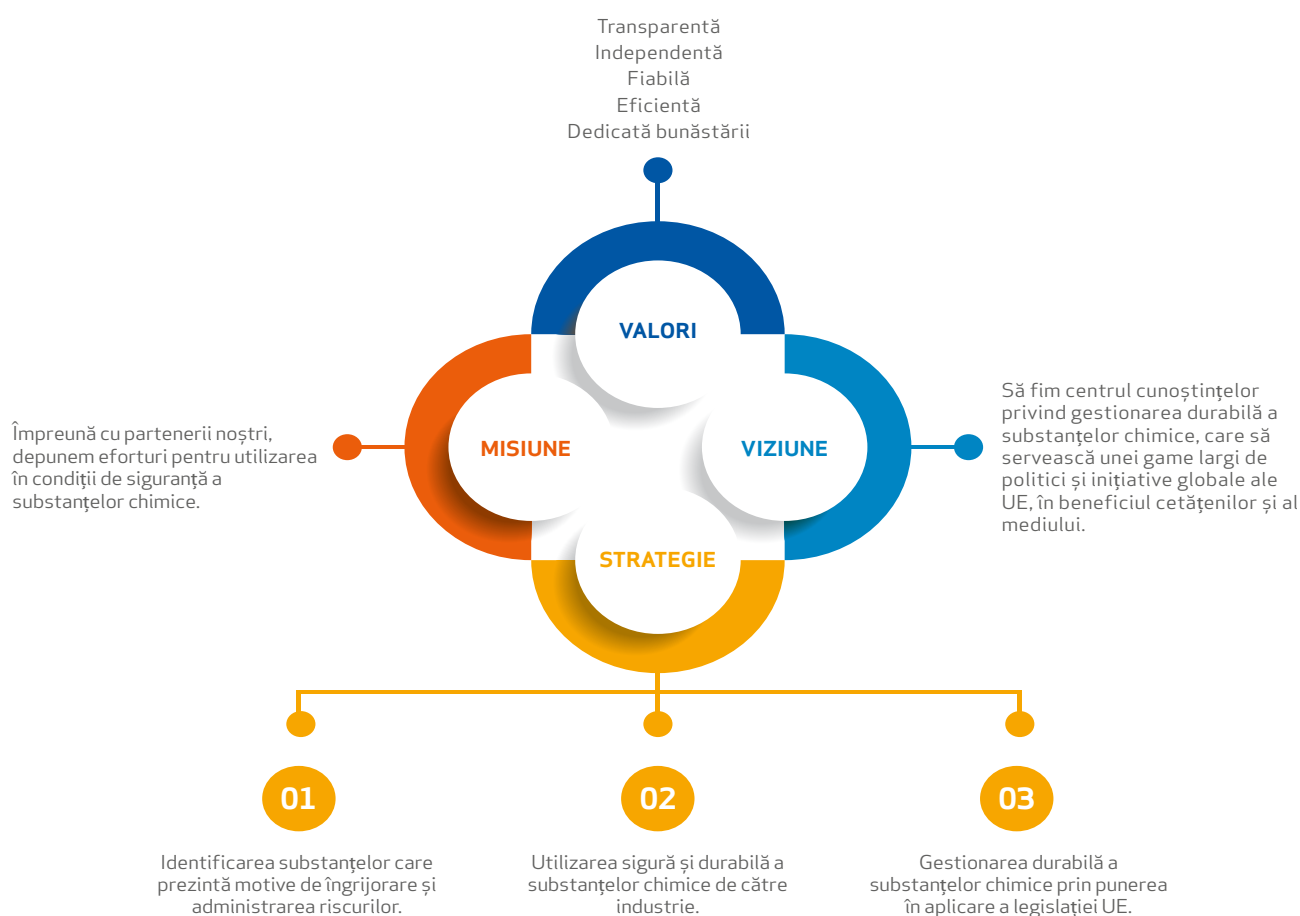
FIGURA 1: Misiunea, viziunea, valorile ECHA

În conformitate cu prima prioritate, ne punem în aplicare sarcinile, integrându-le în activitatea noastră în mod consecvent. În conformitate cu cea de a doua prioritate, ne punem în valoare sarcinile pentru a promova utilizarea substanțelor chimice de către sectorul industrial în condiții de siguranță și sustenabilitate sporite. Și, în conformitate cu cea de a treia prioritate, asigurăm coerența sarcinilor noastre cu cele ale celorlalte legislații UE în domeniul substanțelor chimice și furnizăm sprijin științific și tehnic activităților desfășurate la nivel internațional. Realizările din cele trei domenii sprijină progresul în direcția obiectivelor de dezvoltare durabilă ale Organizației Națiunilor Unite 2 .