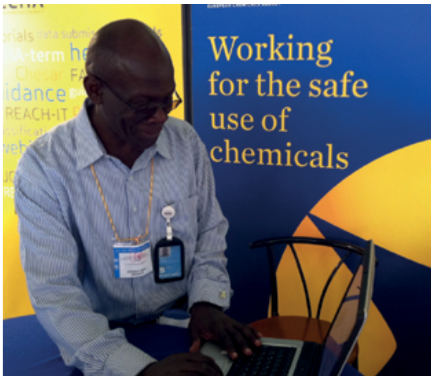
Nairobis toimunud ICCM-3 (kemikaalihalduse) konverentsi osaleja tutvub ameti teabepunktis ECHA kodulehega.