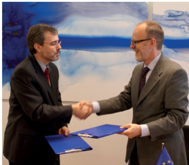
ECHA ja Kanada vaheline vastastikuse mõistmise memorandum kirjutati alla 2010. aastal.

potentsiaalsete kandidaatriikidega, siis Euroopa naabruspoliitika keskendub kokkulepetele ja ühistegevusele 16 riigiga, kes asuvad liidu vahetul välispiiril. ECHA on panustanud mõlemasse poliitikavaldkonda ELi õigustiku ühtlustamise, kohaldamise ja jõustamise kaudu.