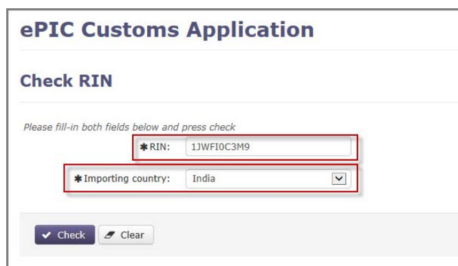
Figura 2: Introducerea datelor

După completarea ambelor câmpuri, utilizatorul trebuie să facă clic pe butonul „Verificare” pentru a extrage datele. Rezultatul căutării va fi unul dintre cele prezentate mai jos.